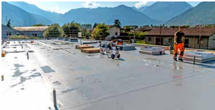
Grâce aux rouleaux pratiques, SikaRoof® AT a pu être déployé rapidement et le toit étanchéifié en peu de temps.

En termes d'économie, d'écologie et de poids, le système de toiture unique avec SikaRoof® AT s'adapte parfaitement à la construction en bois prévue. SikaRoof® AT est une étanchéité hybride TPO de haute qualité, fabriquée en Suisse. Elle peut être appliquée sans aucun solvant et impressionne par sa grande flexibilité de matériaux, ce qui rend l'installation extrêmement facile et permet de gagner beaucoup de temps. En outre, l'étanchéité à elle seule permet d'économiser environ 10 kg par m 2 par rapport aux autres systèmes de toiture. Parfait pour la nouvelle construction de Charrat.