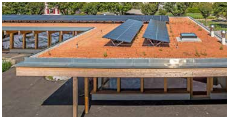
La toiture hybride TPO est très résistante et constitue une base solide pour le système photovoltaïque.