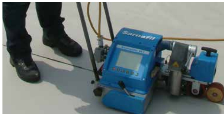
Mit dem Automaten-Schweisgerät Sarnamatic aus dem Hause Sika können die Kunststoffdichtungsbahnen sicher und schnell thermisch verschweisst werden – auch bei winterlichen Temperaturen.

Bereits früh wurde aufgrund des Bauprogrammes klar, dass der Flachdacheinbau in den Wintermonaten erfolgen würde. Die schnell wechselnden Wetterverhältnisse wie Kälte, Regen und Schnee setzten voraus, die Dächer mit der grösstmöglichen Flexibilität und Schnelligkeit einbauen zu können. Bei nur kurzen Wetterfenstern eine Fläche einbauen, abschotten und mit Kontrollrohren für die Überprüfbarkeit sichern – eine Prämisse, die für Sarnafil T passt und steht. Die Kunststoffabdichtungsbahn kann auch bei winterlichen Verhältnissen sauber und sicher thermisch verschweisst werden.