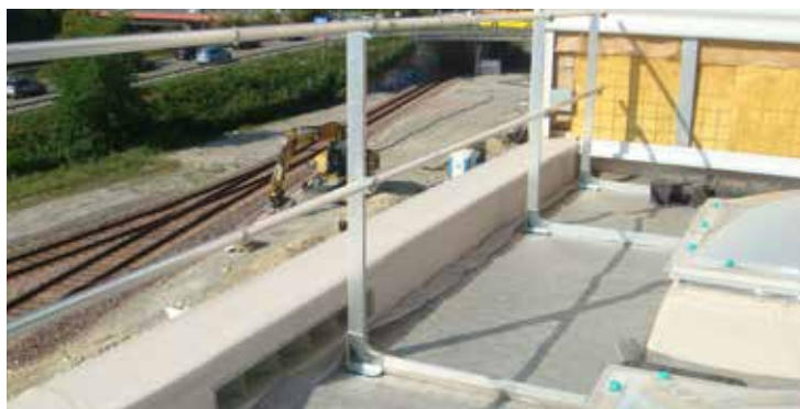
Das Barrial Sicherheitsgeländer wird ohne Durchdringungen eingebaut und erlaubt die volle Bewegungsfreiheit auf dem Dach.

Die Sicherheitselemente wie die Absturzsicherung Seculine Vario sowie das Barrial Sicherheitsgeländer als permanenter Kollektivschutz gewährleisten einen sicheren Dachunterhalt und ergänzen das Sika Dachsystem perfekt.