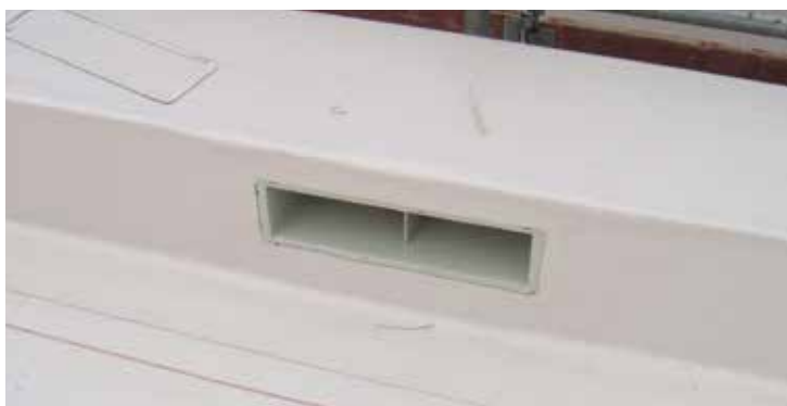
Die Notüberläufe im XL-Format wurden vorgefertigt und mussten auf der Baustelle nur noch mit der Kunststoffabdichtung sicher thermisch verschweisst werden.

Eine solch grosse Dachfläche von über 35'000 m 2 , unterteilt in rund 19 Dächer benötigte ein Dachsystem, welches mit absoluter Sicherheit die hoch modernen Produktionsanlagen vor jeglichen Witterungseinflüssen schützt. Coop entschied sich dabei für ein Sika Dachsystem. Damit konnten alle eingesetzten Elemente aus einem Hause bezogen werden: der ganze Dachaufbau inkl. Dampfbremse, EPS Wärmedämmung, Sarnafil Kunststoffdichtungsbahn, Drainageschicht, Kontrollrohre, die Absturzsicherung Seculine Vario und das Sicherheitsgeländer Barrial. Ausserdem konnte auf die grosse Dienstleistungspalette der Roofing-Abteilung der Sika Schweiz zugegriffen werden: Beratung bereits bei der Planung sowie die Begleitung und Qualitätssicherung während der Bauzeit, inkl. Abnahme der Dachflächen.