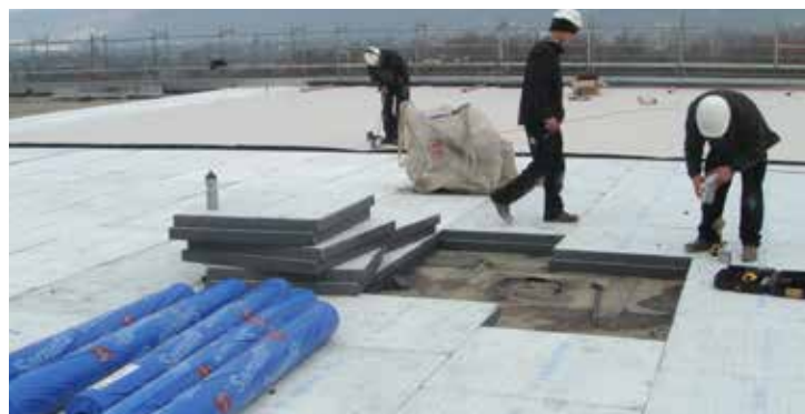
Das Verlegen der Wärmedämmung S-Therm Plus und der Abdichtung Sarnafil TG 66-18 musste aufgrund der winterlichen Verhältnisse schnell und in Etappen erfolgen.

Die eco1-zertifizierte Dämmung S-Therm PLUS 160 mm und die eco1-zertifizierte Kunststoffdichtungsbahn Sarnafil TG stellen die Grundlage für ein ökologisch bestpositioniertes Flachdach: Rund 23'000 m 2 S-Therm PLUS und 37'000 m 2 Sarnafil TG schützen mittlerweile die Produktionsanlagen zuverlässig und sicher.