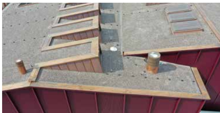
Dank den Sika Schubschwel kann das Kies auf dem geneigten Dach nicht abrutschen.

einfach gemäss Anleitung verbaut werden können. Sie wurden nach Höhe der Nutzschiene und den verschiedenen Längen objektspezifisch hergestellt. Durch speziell angefertigte Formteile mit Dichtungseinlagen konnten die Schubschwelhalter ohne grossen Aufwand abgedichtet werden.