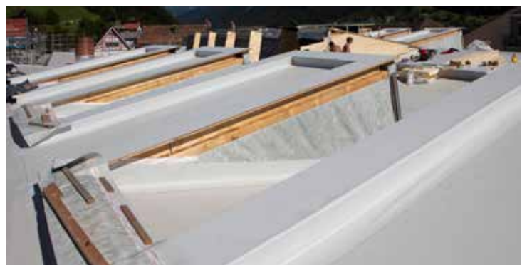
Durch die Flexibilität und der Verlegegeschwindigkeit von SikaRoof AT konnten die 15 Oblichtfenster etappenweise sicher abgedichtet werden.

Die Dachkonstruktion des Kultur- und Gemeindezentrums Mels wurde mit gedämmten Hohlkastenelementen, einer Holzfaserverplatte, der diffusionsoffenen Unterdachbahn Sarnafil MTS und einer Hinterlüftung ausgeführt. Über der Hinterlüftung wurde das eigentliche Flachdach (geneigt) mit SikaRoof AT auf einer Holzschalung und einer Ausgleichslage erstellt. Auf dem Saalgebäude wurden 15 Dachaufbauten mit offenbaren Oblichtfenstern realisiert. Die Dachfläche musste durch die Verlegefirma Burkhardt Gebäudehülle AG, Maienfeld in Etappen abgedichtet werden, nachdem der Zimmermann die gesamte Unterkonstruktion mit Konterlattung und Holzschalung erstellt hatte. Es brauchte somit eine Abdichtung, welche schnell und einfach verlegt werden konnte und die Holzkonstruktion jederzeit vor Nässe schützt. Mit SikaRoof AT wurde diesen Anforderungen Rechnung getragen und das Dach konnte schnell und zuverlässig in Etappen abgedichtet werden.