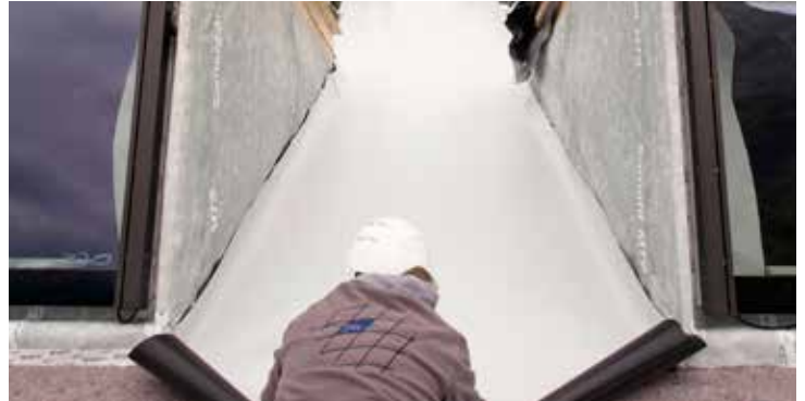
Alles aus einer Hand von Sika: die Kompatibilität aller Produkte wurde gewährleistet und die diversen Schnittstellen wie z.B. zu Einlegerinnen konnten sicher verschweisst werden.

Die hohe Flexibilität von SikaRoof AT ermöglichte es, die vielen An- und Abschlüsse an die Lukarnen, sowie bei Traufe und Ort, schnell abzudichten. Auch alle anderen Detailausführungen konnten mit Sika-Produkten effizient und einfach gelöst werden.