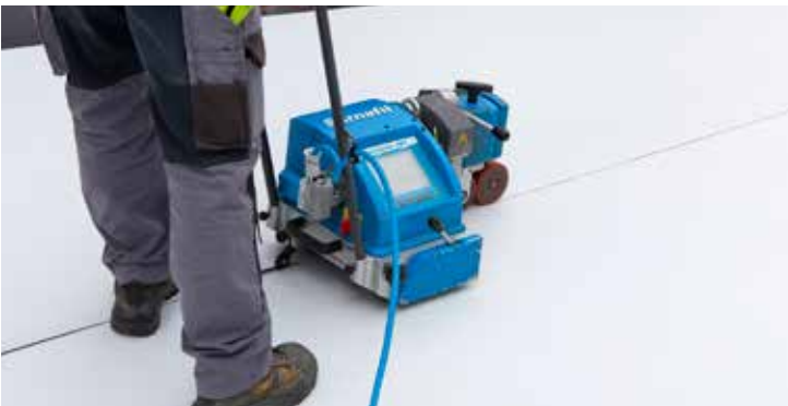
Aufgrund der thermischen Verschweissung – mit dem Sarnamatic oder per Handschweisgerät – kann SikaRoof AT auch für das sichere Abdichten von Dächern mit Holzaufbauten gefahrenfrei eingesetzt werden.

Ein weiterer grosser Vorteil war es, eine Abdichtung zu verwenden, die