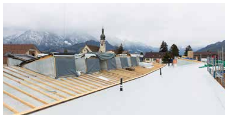
Auch bei wechselhaftem/nassem Wetter konnte das geneigte Dach sicher abgedichtet und auch betreten werden, dank der hohen Rutschfestigkeit von SikaRoof AT.

Zu einem erfolgreichen Projekt gehört natürlich auch das gute Zusammenspiel aller Beteiligten – angefangen von der Bauherrschaft der Gemeinde Mels, die das Vertrauen in die Sika Produkte hat und der Ökologie die nötige Beachtung schenkt, über die raumfindung architekten, welche alles mit Sika Produkten geplant haben hin zum Dachverleger, Burkhardt Gebäudehülle AG, welcher die Produkte professionell und zuverlässig verarbeitet hat. Auch die Bauleitung Rolf Bless Bauleitung & Bauplanung koordinierte alles einwandfrei und die Sika Schweiz AG, die das Projekt von Anfang an beraten und betreut hat, lieferte alle Produkte termingemäss auf die Baustelle.