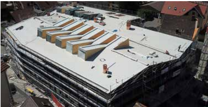
Das geneigte Flachdach mit den diversen Details konnte mit den Sika-Produkten zuverlässig und schnell realisiert werden.

Die Bauherrschaft entschied sich für ein Sika Dachsystem der neuesten Generation. Die Abdichtung SikaRoof AT wurde mittels patentierter Hybrid-Technologie geschaffen und seit 2019 erfolgreich eingesetzt. Sie ist einzigartig und vereint die Vorteile aller bestehenden Abdichtungstechnologien – flexibel, nachhaltig, widerstandsfähig.