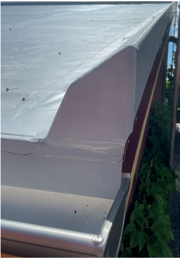
Das Steildach der Stadtgärtnerei ist auf einer Holzkonstruktion mehrschichtig aufgebaut.