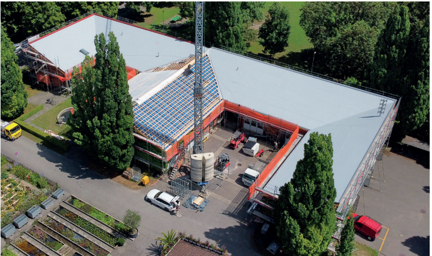
Die Dachabdichtung SikaRoof® AT-18 wird brandschutzsicher mit Heissluft verlegt – ohne Gas und offene Flamme..

den keine schädlichen Stoffe eingesetzt. Das Dachsystem wird lösemittelfrei verlegt und ist dank der Möglichkeit des späteren Recyclings kreislauffähig.