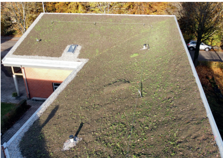
Die Kombination Abdichtung, Schubabsicherung und Begrünung auf einem geneigten Gründach funktioniert.