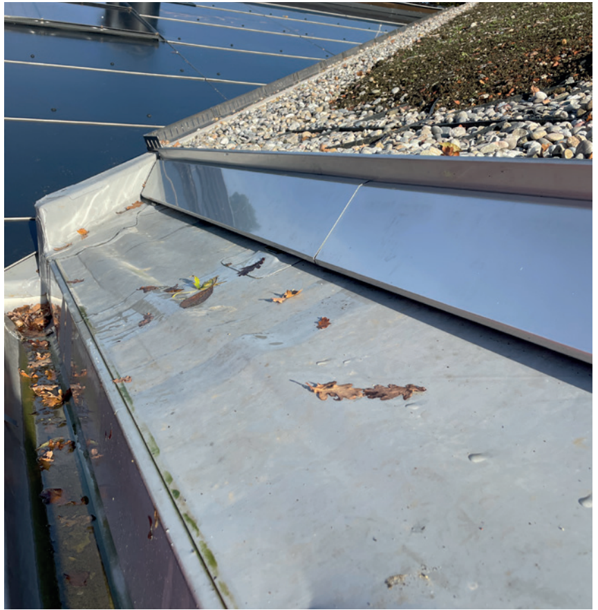
Schubswellen und Georaster ermöglichten einen stabilen Begrünungsaufbau.