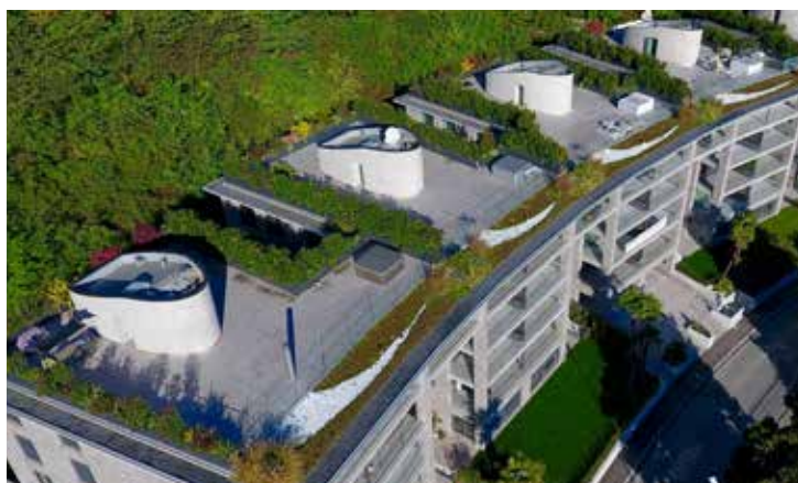
Die verschiedenen Nutzungsarten der Dächer verlangten ein flexibles, anpassbares Dachsystem, welches im Hause Sika gefunden wurde.

Kontakt Telefon 058 436 79 66 info.dach@ch.sika.com www.sikadach.ch