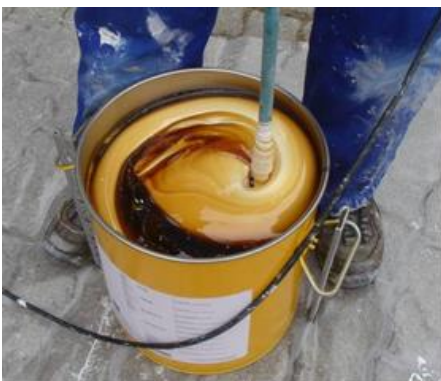
Abb. 3: Mischen des SikaForce®-420 L105

Anschliessend das Material in einen sauberen Behälter leeren (umtopfen) und nochmals gut mischen (Mischzeit ca. 1 Minute).