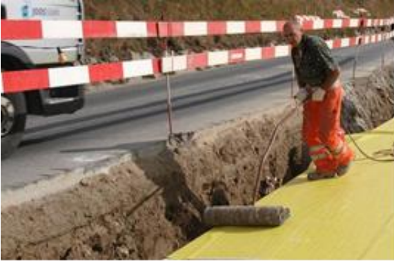
Abb. 7: Anpressen der Sikaplan® WP 2110 mit Anpressrolle

Die Dichtungsbahn wird in der horizontalen mit einer Anpressrolle in den Klebstoff gepresst. Bei vertikalen Flächen wird ein Handroller benutzt.