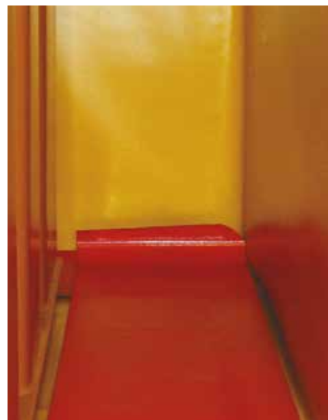
La mise en oeuvre est possible même lors de surfaces restreintes.

Avant toute utilisation et mise en oeuvre, veuillez toujours consulter la fiche de données techniques actuelles des produits utilisés. Nos conditions générales de vente actuelles sont applicables.