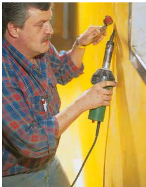
Mise en oeuvre Sarnafil® G 465-15 avec l'appareil à souder à air chaud.