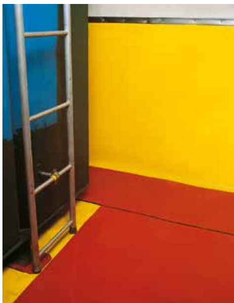
Jaune: Sarnafil® G 465-15 Rouge: Couche de protection dans les zones d'accès