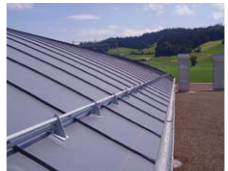
Sarnafil Abdichtungsbahnen (und auch Decorprofile) sind in verschiedenen Farben erhältlich und lassen so dem Architekten grossen Gestaltungsfreiraum

ganz dem heutigen Trend entspricht und die architektonischen Ansprüche vollumfänglich erfüllt. Um das Abrutschen des Schnees zu verhindern, sind oberhalb der Dachrinne Schneefänger montiert. Als dekoratives Element wurden auf die Sarnafil Abdichtungsbahnen ca. 900 m Decorprofile in derselben Farbe Anthrazit aufgeschweisst. So ist das Dach zu einem kleinen Schmuckstück geworden. Dieser Dachaufbau bietet eine sehr gute und ökonomisch sinnvolle Alternative zu einem Blechfalzdach, dem es optisch sehr ähnlich sieht.