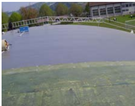
Rund 1'500 m 2 Sarnafil Kunststoffdichtungsbahnen wurden vollflächig auf die Wärmedämmung geklebt

Als oberste Schicht wurde die Kunststoffdichtungsbahn Sarnafil G 410-18EL Felt vollflächig auf die Dämmung geklebt.