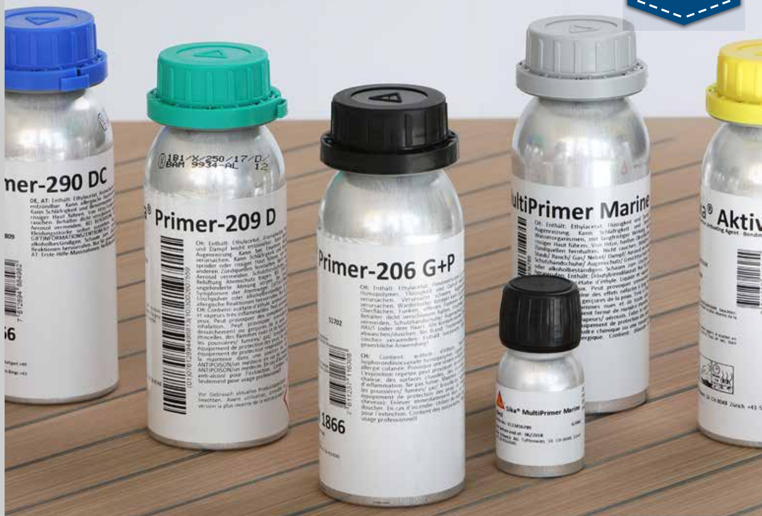
TABLEAU DES PRÉPARATIONS DE SURFACE SIKA

POUR LES APPLICATIONS DE COLLAGE ET D'ÉTANCHÉITÉ DANS L'ENVIRONNEMENT MARITIME