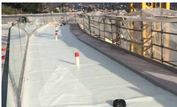
Seculine Vario: sistema anticaduta per una protezione sicura in caso di lavori di manutenzione