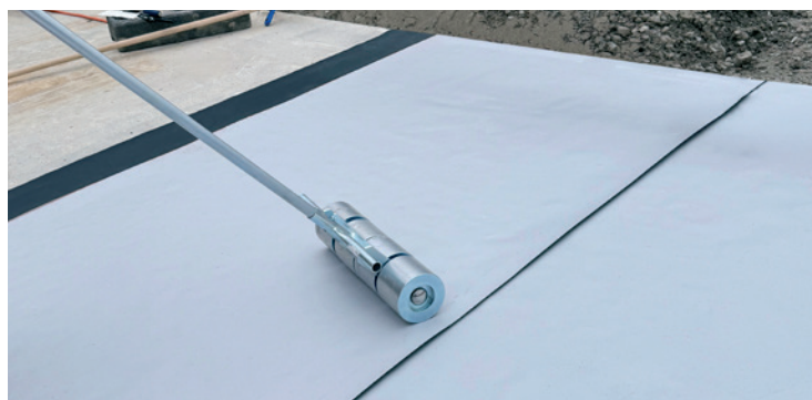
Étape de traitement 3: presser avec un rouleau