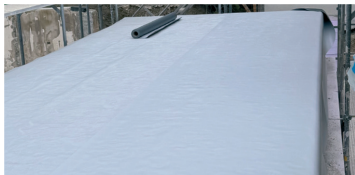
Étape de traitement 4: Soudage des lés

Avant toute utilisation et mise en œuvre, veuillez toujours consulter la fiche de données techniques actuelles des produits utilisés. Nos conditions générales de vente actuelles sont applicables.