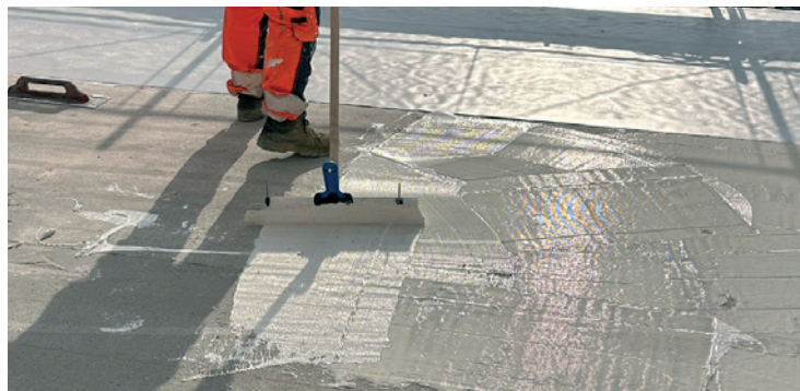
Étape de traitement 1: application de la colle

* Si le support ne correspond pas à la planéité requise selon SIA 272, annexe B, type en adhérence, une remise en état avec une couche d'égalisation Sika EpoCem® ou Monotop® peut s'avérer nécessaire. Pour toute question, veuillez consulter votre conseiller technique Sika Schweiz AG.