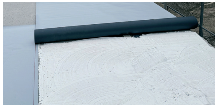
Étape de traitement 2: Dérouler le lé dans la colle