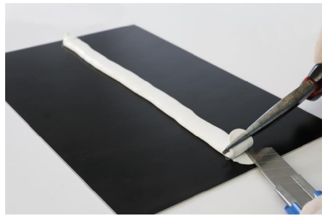
Bild 4: Nach vollständiger Aushärtung die ersten 3 cm der Raupe abtrennen