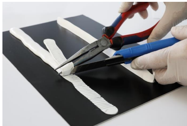
Bild 5: Drehen der Klebstoffraupe, um maximale Spannung und Schnitt zu erhalten