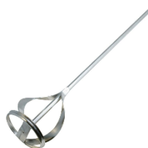
Frusta (per quantità maggiori)