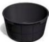
Recipienti per la miscelazione