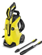
Pulitore ad alta pressione