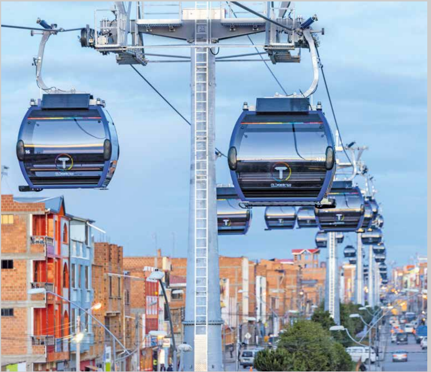
Foto: Mi Teleférico La Paz Bolivien