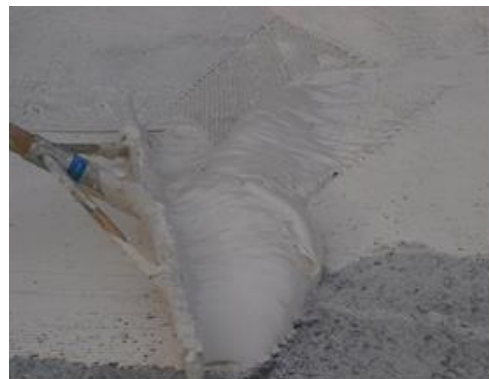
Fig. 5: Application de la colle à l'aide d'un racloir denté