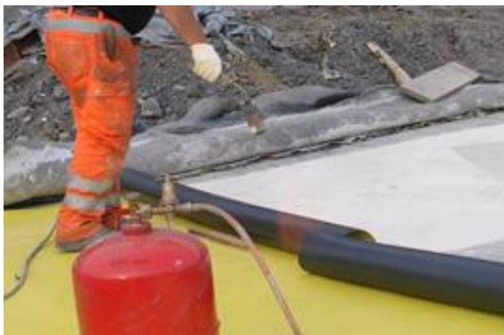
Fig. 6: Flammage et déroulement de Sikaplan® WP 2110

Attention: Éviter le passage à la flamme de la colle.