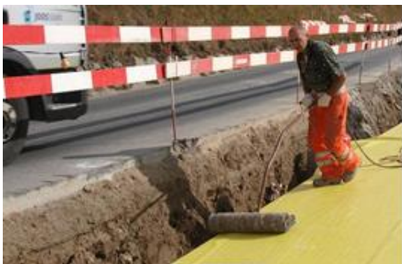
Fig. 7: Pression de Sikaplan® WP 2110 au moyen d'un rouleau de compression

Sur les surfaces horizontales, la membrane d'étanchéité est pressée dans la colle au moyen d'un rouleau de pression. Pour les surfaces verticales, utiliser un rouleau à main.