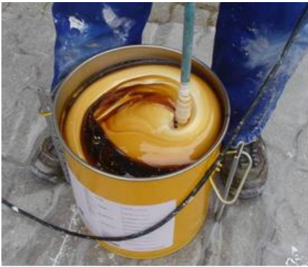
Fig. 3: Mélange du SikaForce®-420 L105