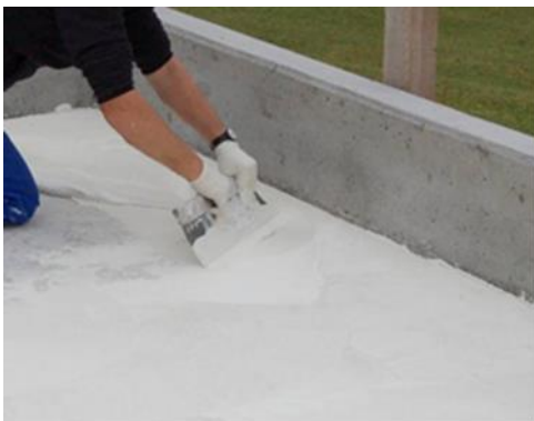
Fig. 4: Application de la colle à l'aide d'une truelle dentée

Nettoyer l'outillage immédiatement après utilisation avec Sika® Colma Nettoyant. Le matériau durci ne peut être enlevé que mécaniquement.