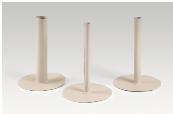
Typ 6: Pfosteneinfassungen offen