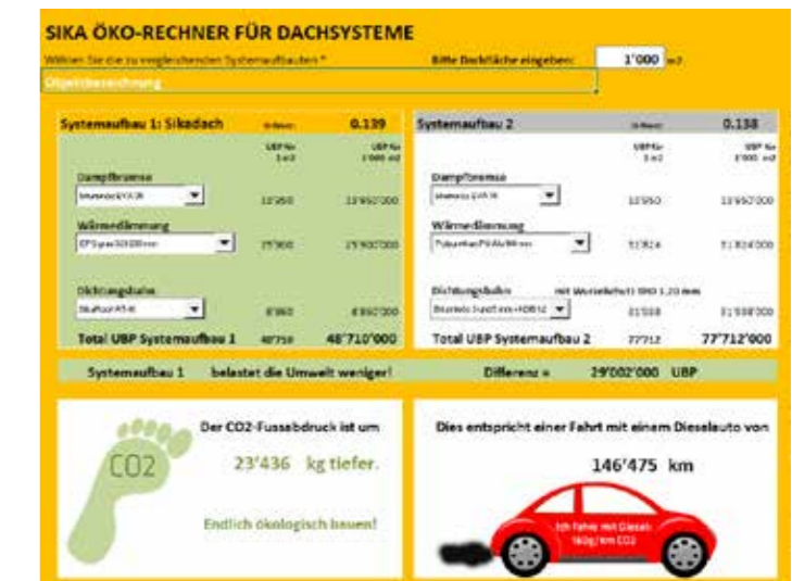
Sika Öko-Rechner: www.sikadach.ch