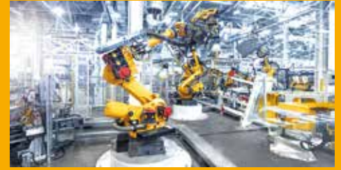
KLEB- UND DICHTSTOFFE FÜR DIE INDUSTRIE

Als Tochterunternehmen der global tätigen Sika AG, Baar/Schweiz, zählt die Sika Deutschland GmbH zu den weltweit führenden Anbietern von bauchemischen Produktsystemen und Dicht- und Klebstoffen für die industrielle Fertigung.