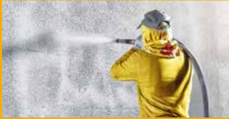
BETONSCHUTZ UND INSTANDHALTUNG