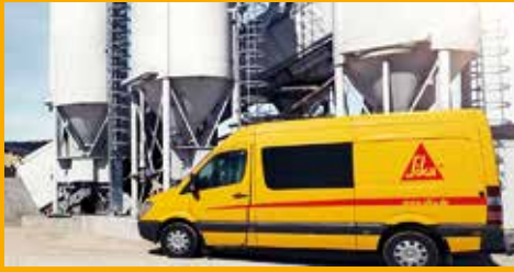
BETON- UND GIPSZUSATZMITTEL