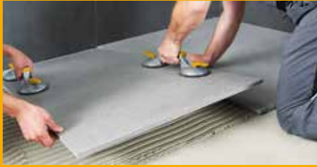
FLIESEN-, WAND- UND FUSSBODENTECHNIK