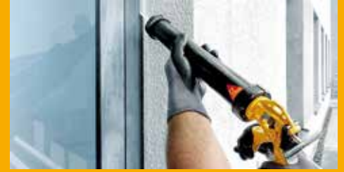
KLEBEN UND DICHTEN AM BAU