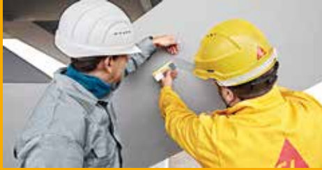
KORROSIONS- UND BRANDSCHUTZ