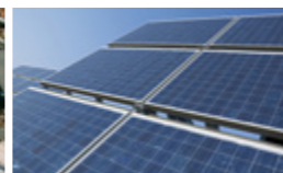
Klebstoffe für die Solarindustrie