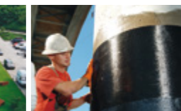
Verbundsysteme für die Verstärkung älterer Strukturen (z.B. Brücken) und die Verlängerung ihrer Lebensdauer