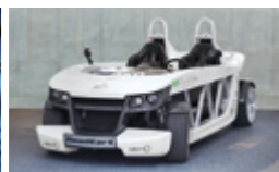
Strukturklebstoffe und polymerbasierte Verstärkungskomponenten für leichtere Fahrzeuge