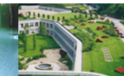
Begrünte Dächer für besseres Klima in Städten