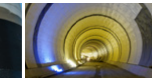
Wasserabdichtungssysteme für Tunnel