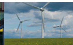
Klebstoffe für langlebige Windturbinen