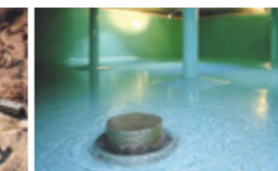
Innenbeschichtungen für Trinkwasserspeicher