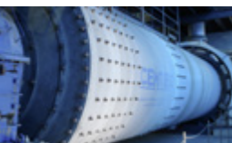
Mahlhilfe für energie- und ressourceneffiziente Zementherstellung

Das wachsende Bedürfnis nach effizienten Infrastrukturen erfordert ressourcen- und kostenwirksamen Lösungen. Unser Ziel ist es, langlebige Leichtbaulösungen mit niedrigem Wartungsaufwand (über die gesamte Lebensdauer) anzubieten, und die Kundenwünsche in Sachen Performance und Robustheit zu erfüllen.