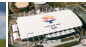
Hochreflektierende Dachmembranen vermindern den Kühlungsbedarf und erhöhen die Effizienz von Solarpanels